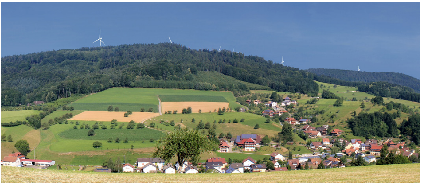
Visualisierung des geplanten Bürgerwindpark Südliche Ortenau (Blick von der Kapelle oberhalb von Dörlinbach auf das Planungsgebiet)

* bei unterstellter Nutzung der Option auf Übernahme der Eigentumsanteile